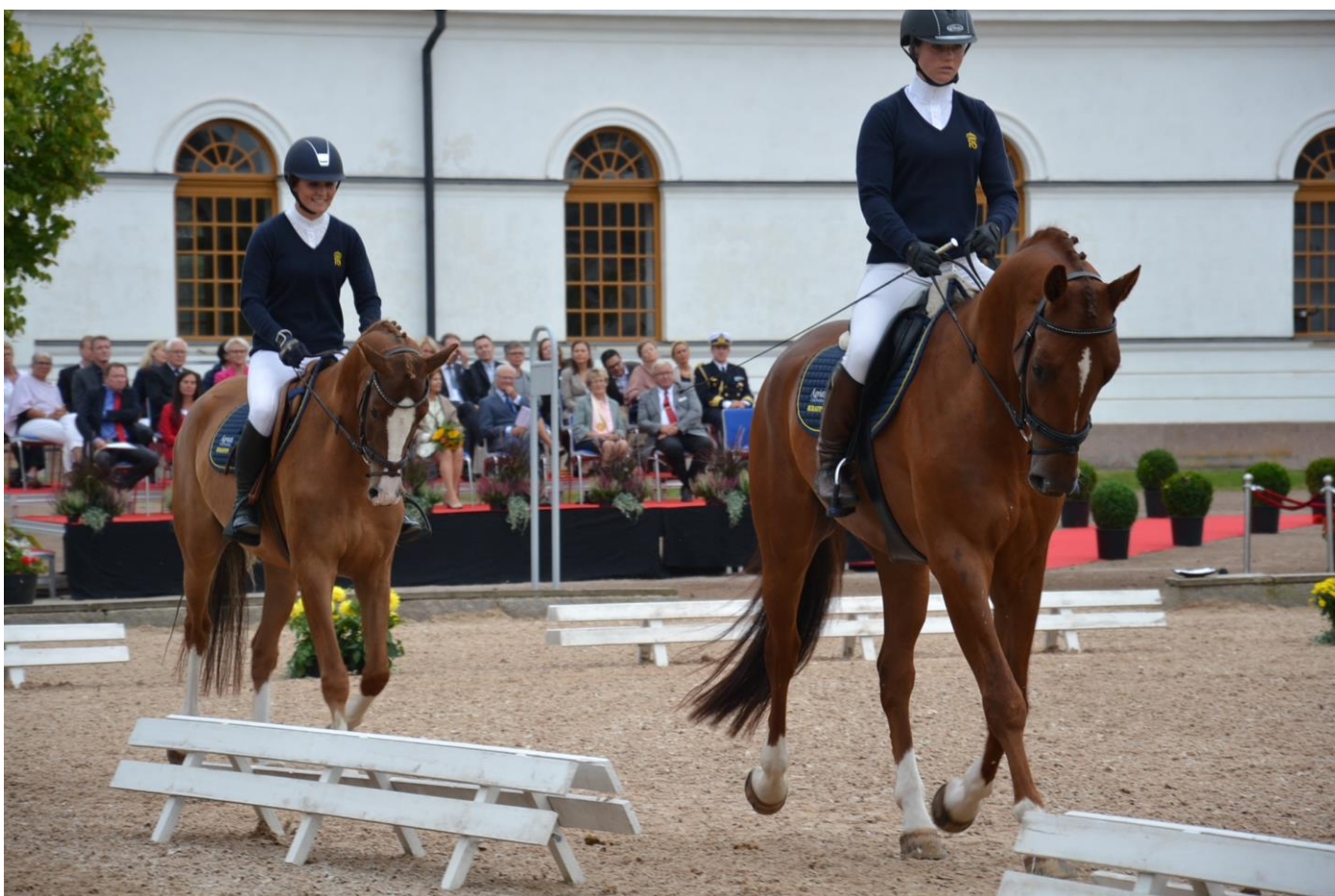
Uppvisning på stallplan

Ridskolan bedriver gymnasieutbildning, yrkesutbildning, universitetsutbildning tillsammans med en diger kursverksamhet.