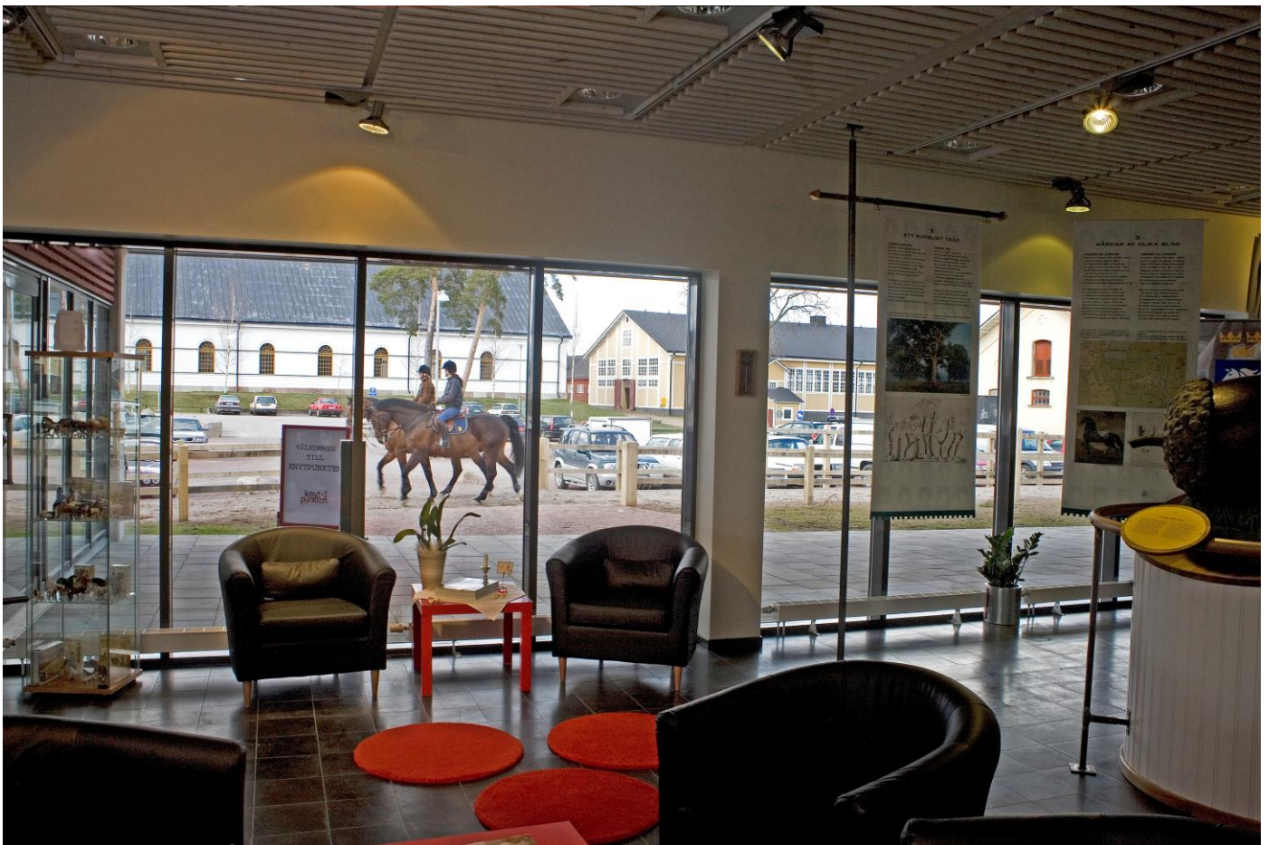
Utsikt från Knytpunkten

Totalt har Ridskolan Strömsholm cirka 1 800 elever per år, inräknat kortare och längre fortbildningar, clinics, sommar- och helgkurser. Över 200 elever deltar i utbildningar längre än ett år. Lika många hästar finns hos ridskolan. Den sista investeringen som gjordes i EU-projektet Program Strömsholm var uppförandet av byggnaden Knytpunkten. Idag är detta Ridskolan Strömsholms elevcentra. Här välkomnas elever och gäster till deras vistelse på Strömsholm. Platsen erbjuder möjlighet att arrangera konferenser med plats för upp till 240 personer. I foajén finns en mycket sevärd utställning om Strömsholms natur och kultur. Hit är du välkommen på besök, liksom till stallarna som alltid är öppna. Passa på att kika in i det vackra vita ridhuset, landets äldsta som är i bruk.